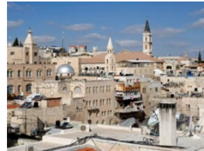
Western Wall in Jerusalem, Israel

Jerusalem ist eine der meistbesuchtesten, spannendsten, inspirierendsten und aufwühlendsten Städte der Welt. Sie ist die Stadt der Städte und dokumentiert 3000 Jahre Glauben, Zusammenleben unterschiedlicher Kulturen und Konfessionen, aber auch Fanatismus und Auseinandersetzungen.