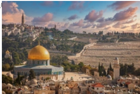
Evening sky with the Dome of the Rock dominating the skyline of Jerusalem