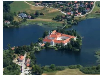
Wasserschloss Kloster S