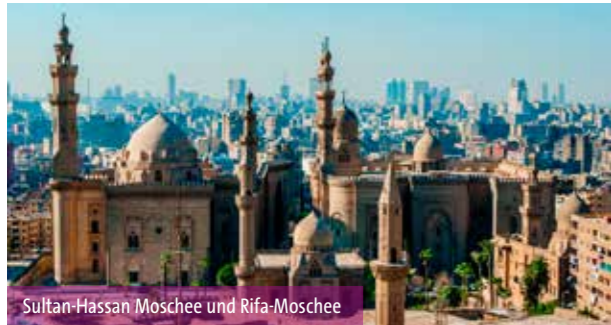
Sultan-Hassan Moschee und Rifa-Moschee

1. TAG: Linienflug mit EGYPT AIR von Frankfurt nach Kairo. Begrüßung durch die Transferassistenz und Fahrt zum Hotel. Übernachtung Kairo.