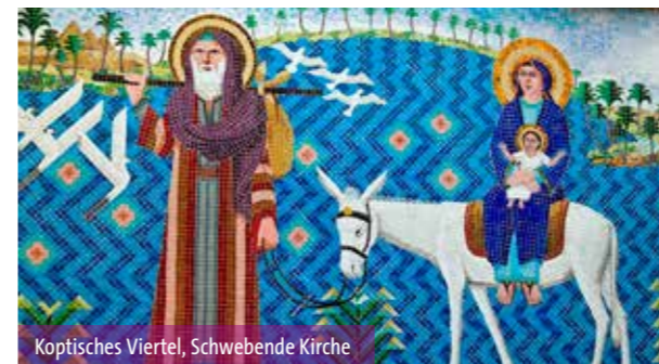
Koptisches Viertel, Schwebende Kirche

5. TAG: Besuch im Islamischen Kunstmuseum , eines der bedeutendsten Museen seiner Art weltweit mit einer Sammlung von seltenen Holzarbeiten, sowie Metall-, Keramik-, Glas-, Kristall- und Textilobjekten von der Omayyadenzeit im 7. Jh. bis zum osmanischen Reich des 19. Jh. Weiter geht es zur Ibn Tulum-Moschee , der flächengrößten Moschee Kairos, die im 9. Jh. errichtet wurde. Anschließend Besuch im Gayer-Anderson-Museum , in dem die traditionelle islamische Wohnkultur, Architektur, Kunst, Archäologie und Kuriositäten zu sehen sind. Der britische Sanitätsoffizier Major Robert Grenville Gayer-Anderson Pascha wohnte in dem Gebäude und stat-