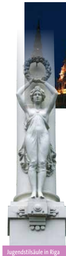
Jugendstilsäule in Riga