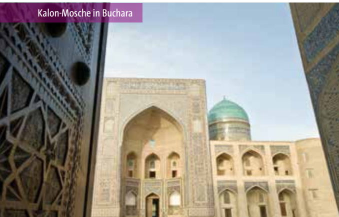
Kalon-Moschee in Buchara

Wir weisen darauf hin, dass Änderungen und Programmumstellungen im Lande nötig werden können.