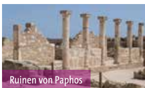
Ruinen von Paphos

Zyperns. Anschließend Besuch der Johanneskathedrale und des Byzantinischen Museums mit einer Vielzahl von eindrucksvollen Ikonen. Gang zu den venezianischen Stadtmauern. Weiter geht es zu Fuß in den Nordteil von Nikosia (Lefkosia) und Besichtigung in der Altstadt: Große Karawanserei/Büyük Han , gotische Sophienkirche , die zweite Krönungskirche des Königreichs Zyperns (heute Selimiye-Moschee), und je nach Zeit die gotische Katharinenkirche , später Haydar Pascha Moschee.