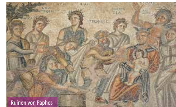
Ruinen von Paphos

nach Limassol zur Besichtigung der Stadt-Burg aus dem Mittelalter. Der Rest des Tages steht zur freien Verfügung .