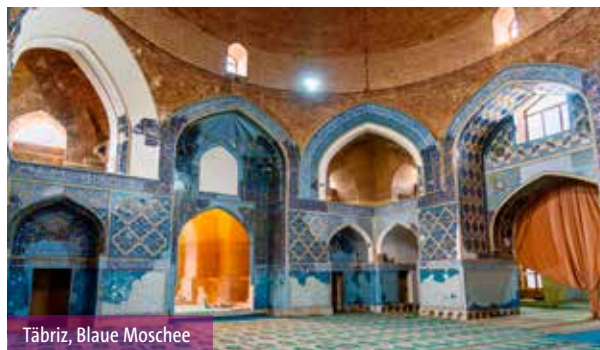
Täbriz, Blaue Moschee

4. TAG: Über eine eindrucksvolle Gebirgsstraße von der wüstenhaften Hochebene führt der Weg hinunter zum grünen Küstenstreifen am Kaspischen Meer . Am Abend Ankunft in Bandar-e Anzali am Kaspischen Meer, das 28m unter dem Meeresspiegel liegt. Die Hafenstadt